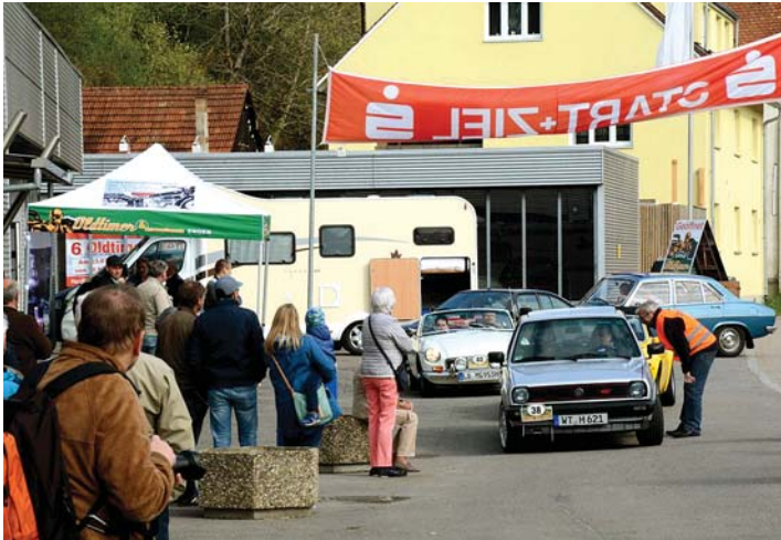
Die Oldtimer-Rallye »Hegau Historic« findet auch 2019 statt. Wie in den vergangenen Jahren ist das Oldtimermuseum in Engen Start und Ziel.