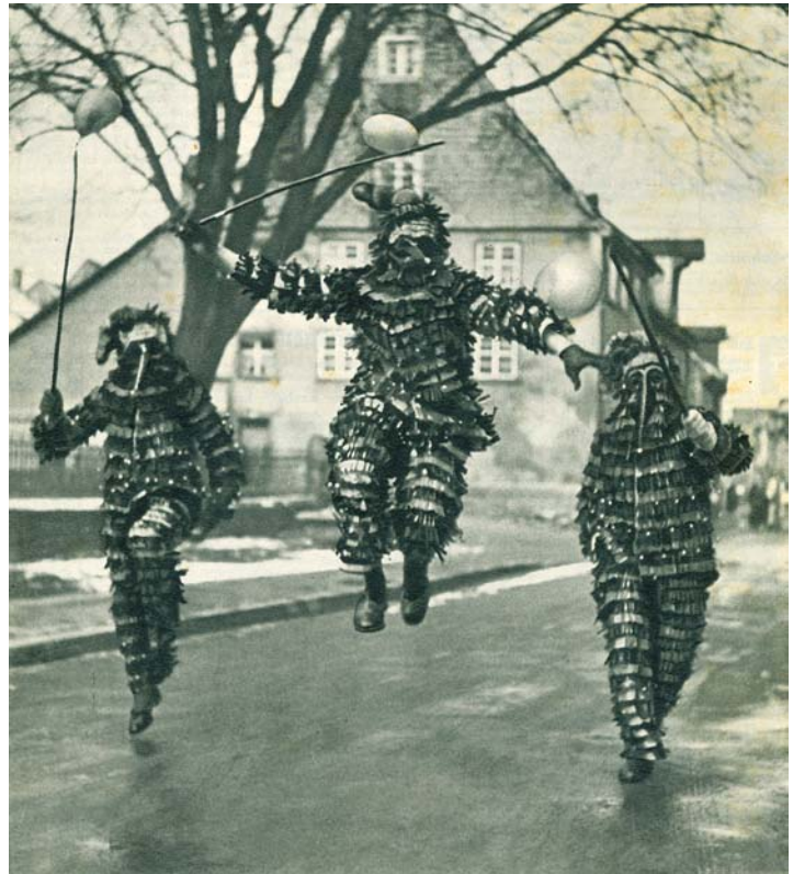
Auch die Hanselegruppe ist keine Untergruppe, sondern stellt die Traditionsfigur der Engener Fasnacht dar. Dieses historische Bild ziert die Titelseite der neu gestalteten Narrenzeitung »Engen Narro«.

Am Schmutzigen Dunschtig wird die Narrenzunft um circa 9.45 Uhr in den Schulen eintreffen und die Schüler befreien. »Gemeinsam werden wir dann um circa 10 Uhr in einem Sternmarsch mit allen Kindern und Jugendlichen, musikalisch begleitet, den Marktplatz ansteuern, wo auch ein Programm von Schülern für Schüler und hoffentlich zahlreiche weitere Narren geplant ist«, kündigt der Narrenzunft-Präsident an. Bevor die Verwaltung den Narren die Amtsgewalt übergibt, wird wieder eine Maskenprämierung (das schönste Einzelhäs und die schönste Gruppe der Kinder) durch die Narreneltern durchgeführt. Anschließend werden leckere Hefebrezeln und als Überraschung noch ein Freige-tränk verteilt. Bei durchgehender Bewirtung und musikalischer Unterhaltung auf dem Marktplatz wird ab 14 Uhr das Wahrzeichen der Narren, der Narrenbaum, aufgestellt. Der Hemdglonkerumzug um 19 Uhr vom Marktplatz bis zur Stadthalle wird mit dem anschließenden Hemdglonkerball noch ein weiterer Höhepunkt des Haupttages der Engener Fasnacht sein.